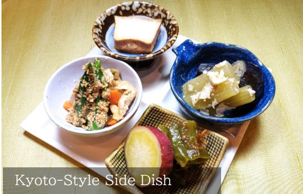
Kyoto-Style Side Dish