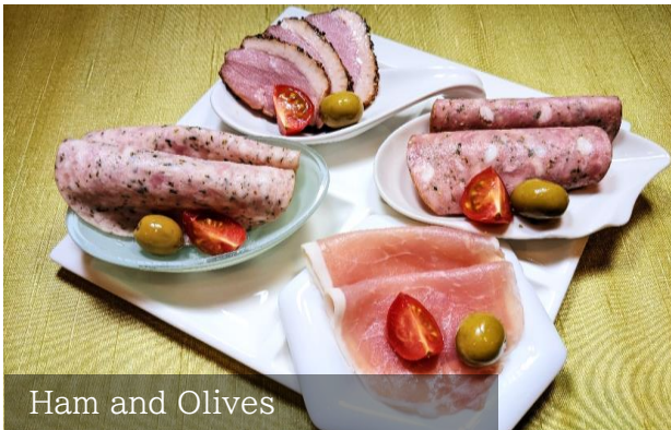
Ham and Olives